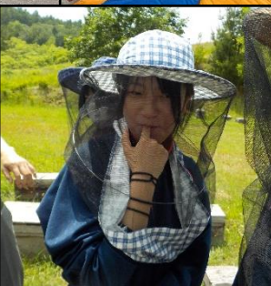
蜂の話に聞き入る2年生