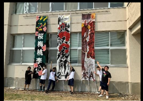
コロナ禍を経て6年ぶりに復活した「クラス旗」。自慢気にポーズをとる代表生徒達。