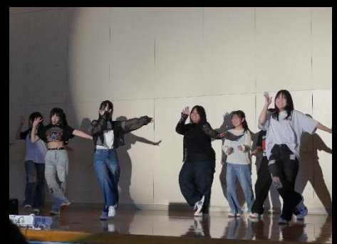
自由発表。バンド演奏やダンス、カラオケなど10組が出演し、大いに会場を盛り上げました。