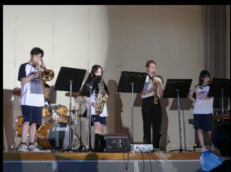
テーマ曲「バイマイフレンド」を含む全6曲を演奏し、開祭式を盛り上げた吹奏楽部。