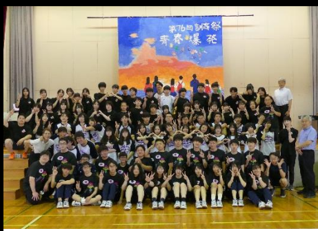
今年度は1年生37名が加わり全校生徒85名での記念写真となりました。

閉祭式では、今年度から復活したクラス旗をはじめ、トーンチャイム、クラスパフォーマンスの3部門で審査を行い、見事、3年A組が優勝を成し遂げました。2日間で延べ150名を超える来場者があり、大盛況で幕を閉じることができました。2日間、誠にありがとうございました。