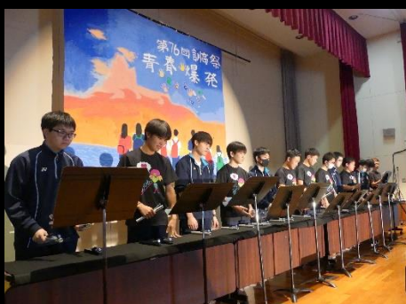
3年A組のトーンチャイムは、「任天堂メドレー」と「ブルーバード」を演奏しました。