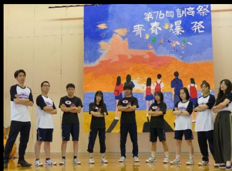
第76回訓高祭を企画・運営してくれた生徒会執行部の皆さん。テーマは「青春爆発」!